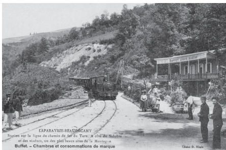
La station de Laparayrié-Beaudecamy